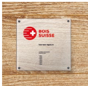
Labellisation d'objets Label Bois Suisse

Le Label Bois Suisse est utilisé dans toute la filière bois, de l'exploitation forestière au détaillant ou à l'architecte, en passant par la scierie et la menuiserie. Il constitue un symbole clair, synonyme de qualité, d'origine, de durabilité et de confiance – un signe clair en faveur du Bois Suisse.